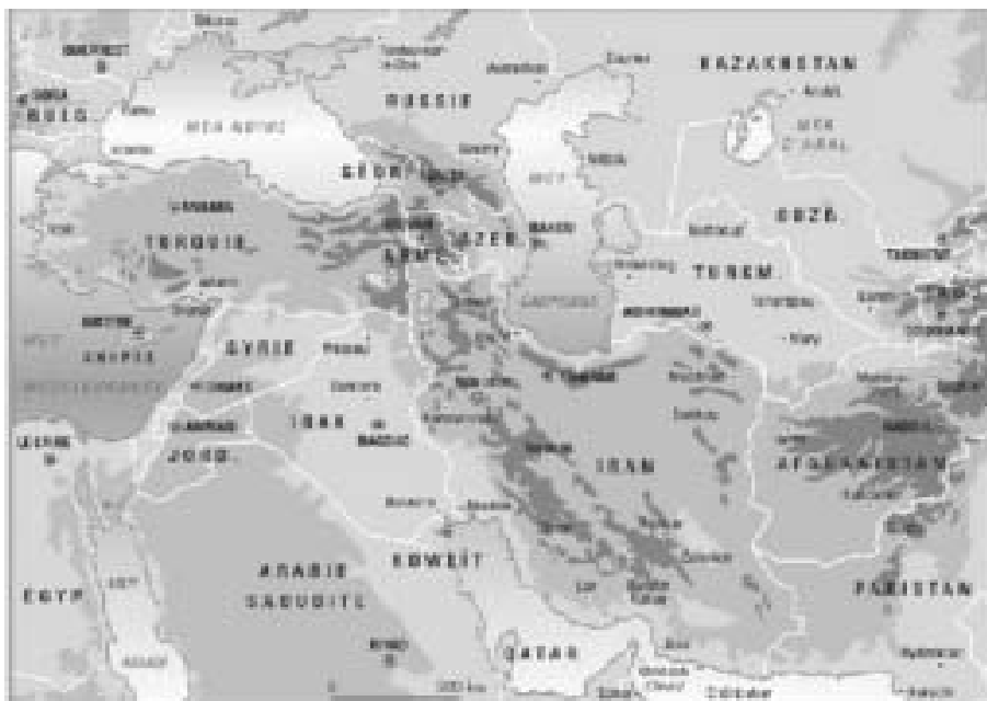
Projeções geopolíticas do Mar Cáspio

Em 1999, o Congresso dos Estados Unidos aprovou a Silk Road Strategy (SRS), renovando o Foreign Assistance Act of 1961, com o objetivo de dar maior assistência e apoio econômico e independência política aos países do sul do Cáucaso e da Ásia Central, avançar seus interesses geoestratégicos na região e opor-se à crescente influência política de potências regionais como a China, Rússia e Irã. 36 Conforme explicitado na Silk Road Strategy, esta região ao sul do Cáucaso e Ásia Central podia produzir petróleo e gás em suficientes quantidades para reduzir a dependência dos Estados Unidos em relação às voláteis fontes de energia do Golfo Pérsico. 37 Alguns cálculos indicavam que, por volta de 2050, a “ landlocked ” Ásia Central proveria mais do que 80% do petróleo importado pelos Estados Unidos e daí a premente necessidade de controlar as reservas de petróleo da região e os oleodutos através do Afeganistão e da Turquia, principal objetivo da invasão do Afeganistão em 2001.