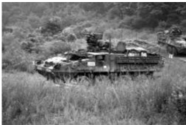
Carro de assalto blindado para operações nas selvas

Na realidade, é o Pentágono que determina e dirige a política exterior dos Estados Unidos com respeito à América Central e à América do Sul. A República da Guyana permitiu que a Beal Aerospace Technologies, companhia americana, construísse uma base para lançamento de foguetes e satélites, em Essequibo, território litigioso, disputado pela Venezuela, o que permitiria estabelecer a presença militar dos Estados Unidos, ao longo do seu flanco oriental. Mas não somente através da Guyana, em cuja costa a Exxon Mobil, com a filial Esso Exploration and Production Guyana Ltd., iniciou a exploração de petróleo em águas profundas, os Estados Unidos tratam de aumentar sua presença na Amazônia. O secretário de Defesa dos Estados Unidos, Robert Gates, propôs ao presidente do Suriname, em outubro de 2007, o estabelecimento de uma base no seu território para testar os novos veículos militares desenvolvidos, pela General Dynamics Combat Systems, destinados a operações nas selvas. 45