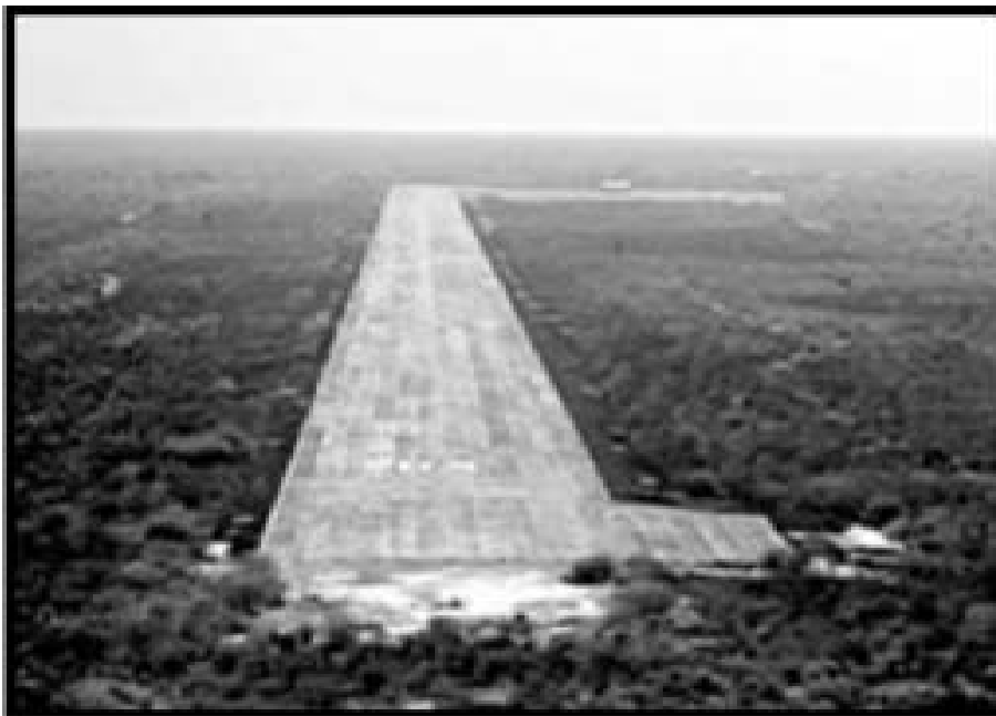
Pista do aeroporto na base aérea em Mariscal Estigarribia , no Paraguai

Com as operações navais da IV Frota, os Estados Unidos complementam o anel de bases militares, que envolve Comapala, em El Salvador; Guantánamo, em Cuba; Comayuga, em Honduras; Aruba, em Curaçao; e Manta, no Equador, de onde deverá ser transferida para a Colômbia. Este anel seria ainda arrematado com a base aérea, construída em 1983 e posteriormente ampliada, em Mariscal Estigarribia, no Paraguai, distante apenas 200 quilômetros da fronteira com a Bolívia e a Argentina, e 320 quilômetros do Brasil, muito perto da Tríplice Fronteira. Esta base aérea, aonde as tropas da Special Operations Forces (SOF) começaram a chegar em 2005, com imunidades concedidas pelo governo paraguaio, possui uma pista de 3.500 metros de longitude e tem capacidade para aquartelar 16.000 soldados 53 .