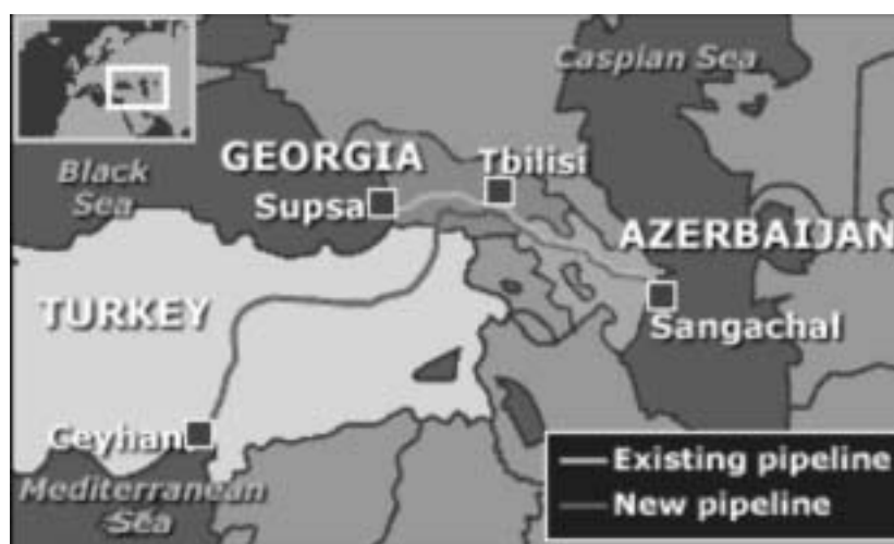
Rota do oleoduto Baku-Tbilisi-Ceyhan

Os vínculos militares estabelecidos pelos Estados Unidos com a Geórgia, inclusive incentivando sua aspiração de ingressar na OTAN, envolvem igualmente importante interesse econômico e geoestratégico, que é garantir a segurança dos dutos de petróleo e gás, entre os quais o oleoduto Baku-Tbilisi-Ceyhan (BTC). Este oleoduto, que passa pelo território da Turquia, permite às companhias ocidentais desviar da Rússia e do Irã o fluxo de petróleo procedente do Azerbaijão e de outras repúblicas da Ásia Central, e destarte reduzir a dependência do Golfo Pérsico. Sua construção pelas companhias BOTAS Petroleum Pipeline Corporation e Bechtel Corporation (Bechtel Group), esta última intimamente vinculada ao presidente dos Estados Unidos, começou em 2002 e terminou em 2006, ao mesmo tempo em que os Estados Unidos tratavam de estreitar as relações militares com a Geórgia, mediante o envio de assessores com a missão de treinar seu exército.