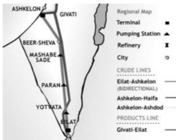
Oleoduto Trans-Israel Eilat-Ashkelon