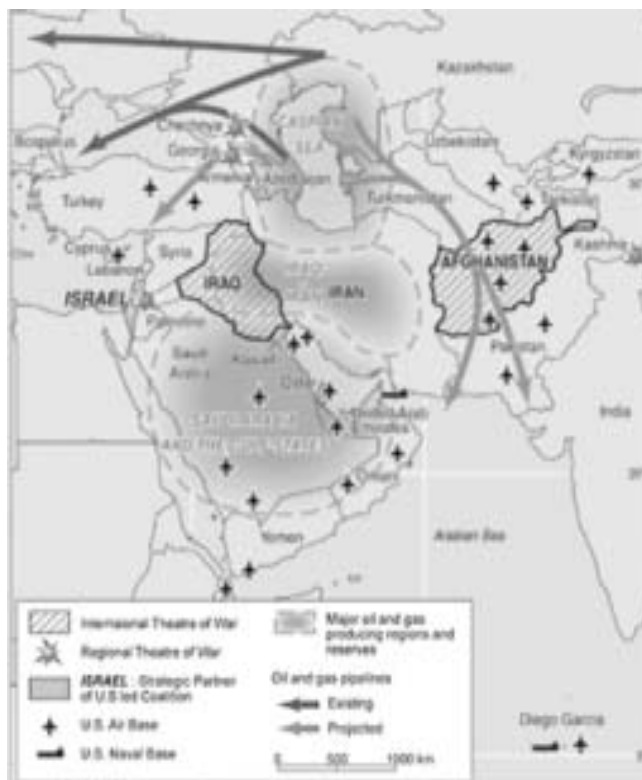
O teatro de Guerra no Oriente Médio

os países islâmicos, com reflexos diretos sobre o teatro de guerra no Oriente Médio. Abre-se assim novo capítulo nas relações internacionais.