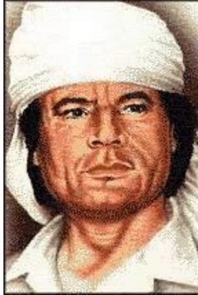
Muammar Al Qathafi